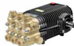
SW / TW Premium