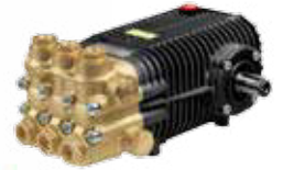
SW / TW Premium